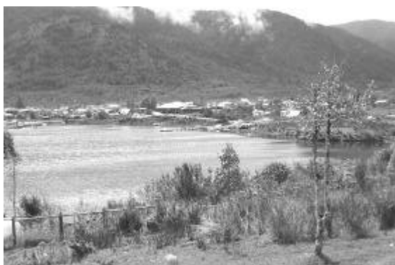
Pto. Puyuhuapi bajo la llovizna, octubre 2004.

Este puerto, como muchos otros lugares de la Región, tiene el encanto de la leyenda o del nombre de un algún antiguo poblador chilote (estamos hablando de comienzos del siglo XX). En efecto, el paraíso de los poyes y la riada vecina eran dominios del indio Antipani, que recorría las costas en busca de baguales, de los cuales poseía una respetable hacienda, no sabemos si en las