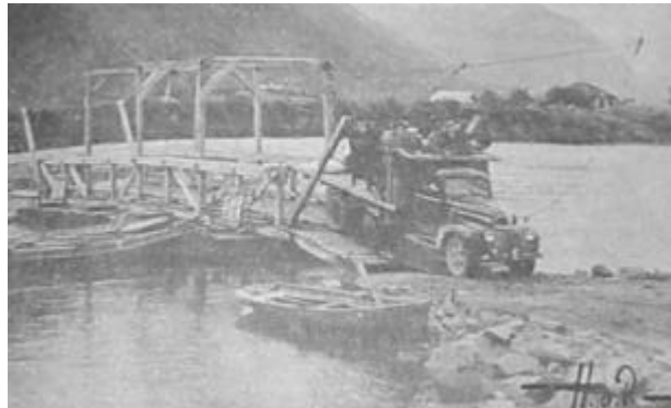
Pto. Aisén, 1952. La balsa del Río Aisén en el lugar del actual puente colgante.